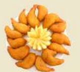
Gambas Gabardina 17.50€