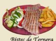
Bistec de Ternera 18.90€