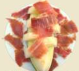
Melón con Jamón 15.90€