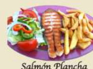
Salmón Plancha 21.50€