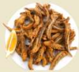
Boquerones Fritos 14.90€ (½ 8.50€)