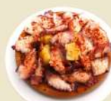
Pulpo Gallega 23.50€