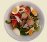
Ensalada Mixta 13.50€