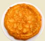
Tortilla Española 14.50€ (½ 8.00€)