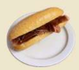
Jamón Ibérico 8.00€