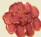
Lomo Ibérico 24.50€ (½ 14.00€)