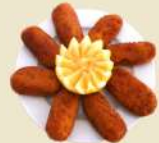
Croquetas Jamón/Boletus 14.50€ (½ 8.00€)