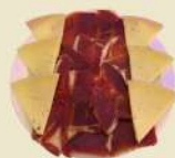
Mixta Jamón y Queso 24.50€