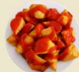
Patatas Bravas 8.90€ (½ 5.90€)