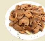
Champiñón Ajillo 12.90€