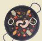
Paella Negra 17.50€