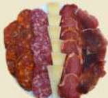
Surtido Ibéricos 29.00€