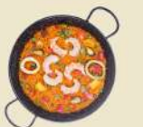
Paella Marisco 17.50€