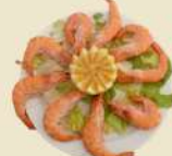
Langostino Cocido 21.00€