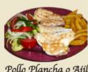
Pollo Plancha o Ajillo 16.90€