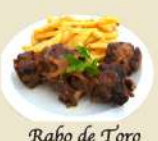
Rabo de Toro 24.50€