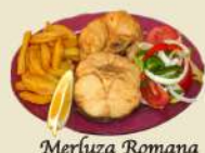
Merluza Romana 21.50€