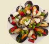
Mejillones Vinagre 13.50€ (½ 8.00€)