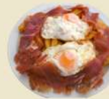
Huevos Rotos 15.90€