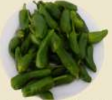
Pimientos Padrón 12.90€