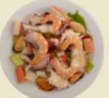
Salpicón Marisco 22.90€ (½ 13.50€)