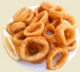
Calamares 16.50€ (½ 9.50€)