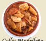
Callos Madrileña 15.90€