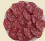
Salchichón Ibérico 17.90€ (½ 9.90€)