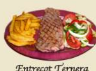
Entrecot Ternera 24.90€