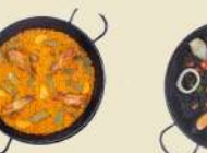
Paella Verdura 16.90€