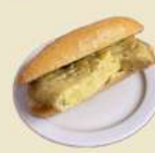
Tortilla Española 5.90€