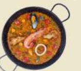
Paella Mixta 17.90€