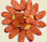
Chorizo Frito 17.50€ (½ 9.90€)