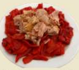
Pimientos con Atún 12.50€