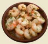
Gambas Ajillo 21.00€