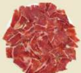
Jamón Ibérico 24.50€ (½ 14.00€)