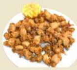
Chopitos 17.50€ (½ 9.50€)