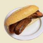
Chorizo Frito 6.50€