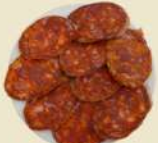
Chorizo Ibérico 17.90€ (½ 9.90€)