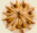
Boquerones Vinagre 14.90€