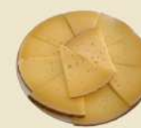
Queso Manchego 17.90€ (½ 9.90€)