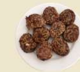
Morcilla Burgos 13.50€